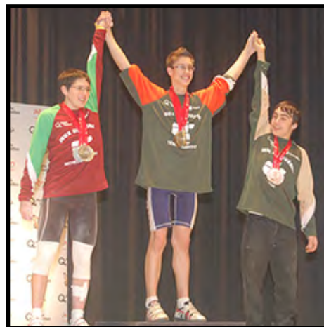
Les médaillés de la catégorie 56 kg aux Finales des Jeux du Québec - Hiver 2013.