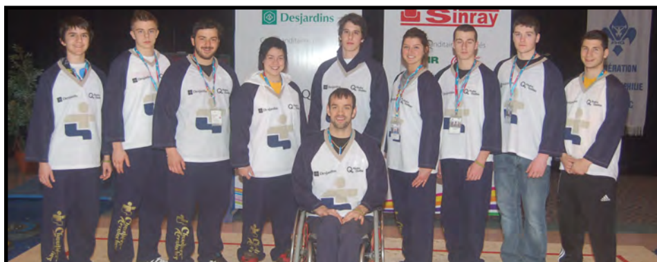
Région Chaudières-Appalaches aux Finales des Jeux du Québec - 2011.